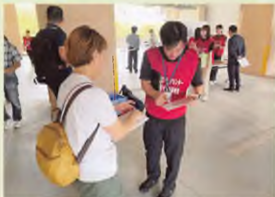
▲ボランティアから活動後の報告を受けている様子

(※)「福岡市災害ボランティアセンター設置に関する協定」 福岡市で大きな災害が発生した際、被災者へのボランティア支援の拠点となる災害VCの設置場所に関する協定です。現在、市内4つの大学（学校法人西南学院、学校法人都築学園、学校法人福岡工業大学、学校法人福岡大学）と協定を締結しています。