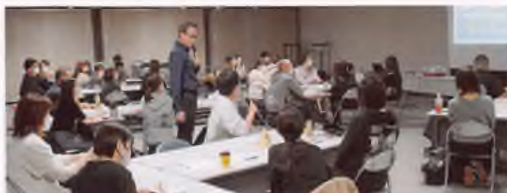
▲令和7年度「リーダー(指導的職員)研修」の様子