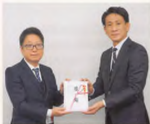
▲株式会社円満シニアサポート様