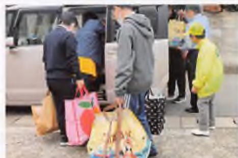
▲買い物を終えて、車に乗る様子

地域住民と地域の事業所相互で顔の見える関係をつくりながら、地域住民の生活を共に支えています。